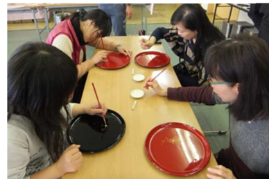
④칠기 공예 체험