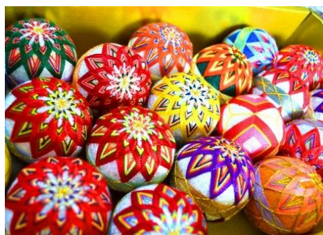
③ 紀州手鞠製作體驗